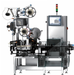
Single Pack Serialisation